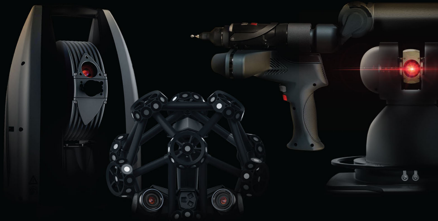
PLATE-FORME DE MÉTROLOGIE PORTABLE DE PREMIER PLAN

Réputé pour la puissance et la stabilité de ses interfaces matérielles directes, PolyWorks | Inspector offre un vaste ensemble de technologies de guidage qu'utilisent les plus grands fabricants d'équipement internationaux pour implanter des procédés de mesure efficaces, précis et répétables pour leurs dispositifs de métrologie portable.